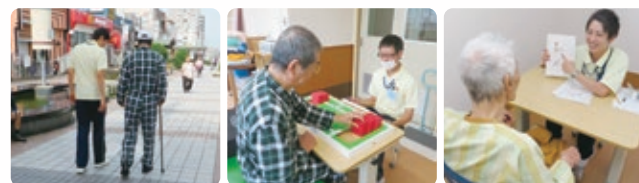
●理学療法（屋外訓練） ●作業療法 ●言語聴覚療法

外来リハビリでは骨折や脳卒中後などで日常生活に不安のある方に対して、通院でのリハビリテーションを提供しています。週に1回から利用可能です。時間も応相談です。