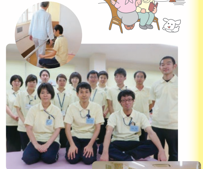
♥活気のあるスタッフが皆様をお出迎えます！